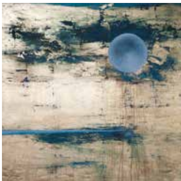
Mojca Fo: Zavaruj me